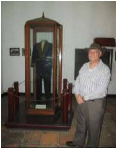
Traje que uso Rubén Darío como diplomático.

Las calles anchas de León, sus casas con anchas paredes de adobe, su techo alto de teja, sus balcones coloniales, sus patios con jardines internos le dan el encanto de una ciudad de amable encuentro.