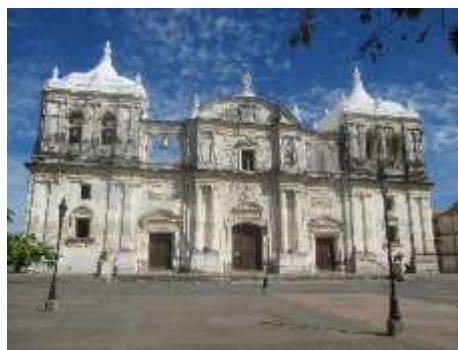
Catedral de León frente al Parque Central con su atrio contornado por leones. El campanario y a una lado la campana mayor, comentan que ésta solo debe ser tañida cuando llegue a la ciudad un Sumo Pontífice o cuando sea el fin del mundo, esta custodiada por dos atlantes, la adornan sus cúpulas y portales y es símbolo de la ciudad.

Se recibió a los visitantes extranjeros, se procedió a la inscripción y se dio la bienvenida en la Iglesia del barrio indígena de Sutiaba en la cual los frailes españoles en aplicación del sincretismo religioso entre españoles e indígenas para atraer a los nativos al catolicismo y lograr que entraran al templo colocaron en la parte alta del techo su “dios sol” con rostro de viejo.