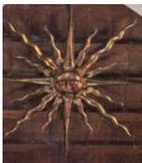
El sol con rostro de viejo.