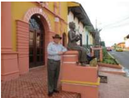
Teatro Municipal Mena sede del evento.

Por la tarde aquí se desarrolló una peña de poetas y poetisas noveles de toda Nicaragua y asimismo el poeta existencialista David Róbinson de nacionalidad panameña dictó un taller de poesía.