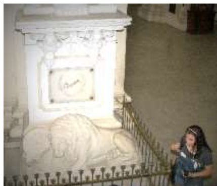
León silente echado sobre la tumba de Darío y el escudo Dariano al lado del escudo de Armas de Nicaragua.

Se visitó la Tumba de Rubén Darío en la Catedral de León Nicaragua y hubo actos litúrgicos; se ofreció un almuerzo típico.