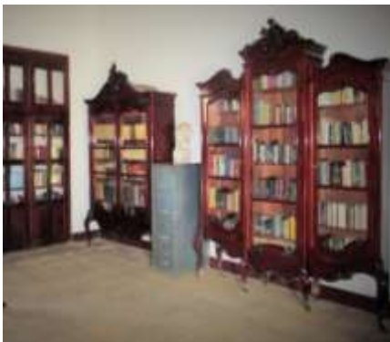
Parte de la Biblioteca en el Museo y Archivo Rubén Darío en la ciudad de León.

Se hizo un recorrido por el Museo Archivo Rubén Darío, allí se encuentra, el traje diplomático usado por Rubén en la Corte de Alfonso XIII de España; el sofá cama que le regalo en 1915 dictador guatemalteco Rafael Estrada Cabrera; el crucifijo que le regalo el poeta mexicano Amado Nervo; fotografías de Rubén y su familia y libros de su propiedad, etc.