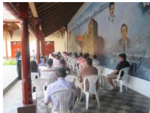
Lectura de poemas en la Casa Cultural Rigoberto López Pérez.

En amplios salones exhiben avíos de iglesia, cristos, reliquias, pinturas de La Santísima Trinidad, vírgenes, objetos precolombinos, arte, picasos y pinturas modernas. Se recorren pasillos, patios coloniales con fuentes, jardines, pilas y desagües.