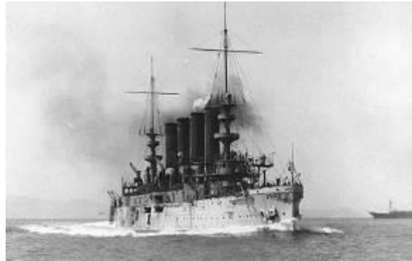
Cañonera Milwaukee 1924.

EL DESTINO MANIFIESTO. Esta doctrina justifica la necesaria expansión, no sólo como algo inevitable, sino como un mandato racial, según la cual los anglosajones están predestinados a mandar y las demás razas a servir.