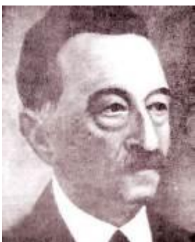
General Rafael López Gutiérrez