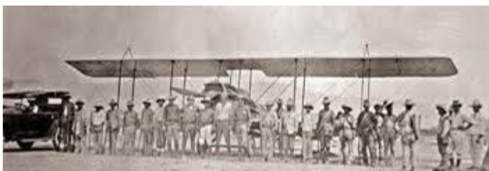
Avión Lincoln Estándar.

4 de abril de 1924. - “Se asegura también en el campamento revolucionario que de hoy a mañana llegará a Toncontín un aeroplano que vendrá a bombardear la capital”