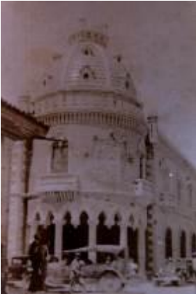
Casa Presidencial, 1920

EL GOBIERNO DE PACAN. Del 26 al 28 de octubre de 1919 se llevaron a cabo las elecciones generales en Honduras. Fueron electos los candidatos del Partido Liberal Republicano, General Rafael López Gutiérrez, como Presidente y José María Ochoa Velásquez como Vicepresidente. Tomaron posesión del gobierno en Tegucigalpa el día 1 de febrero de 1920. López Gutiérrez, gobernó de 1920 a 1924 y de facto cuarenta días , (del 1 de febrero de 1924 al 10 de marzo de 1924). Fue conocido cariñosamente como “Pacán” según dicen por que de joven presumía de una pistola Alemana, cuya marca se pronunciaba en forma parecida a su popular sobrenombre.