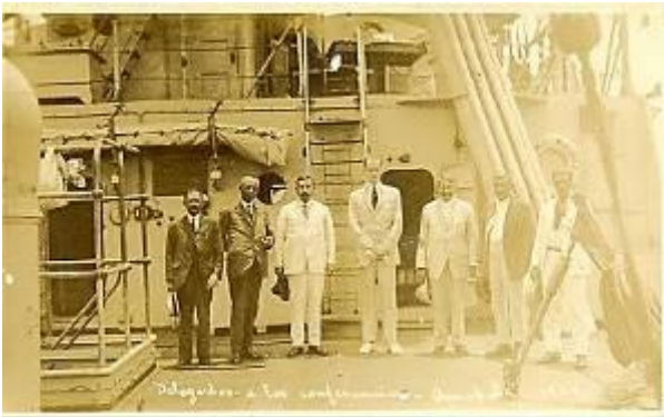
Comitiva de paz en el “Milwakee”, al centro, de blanco, Sumner Welles.

El día 23 de abril de 1924, las partes deliberantes están presentes en el crucero USS “Milwakee” comandado por el almirante Dayton. La Conferencia de Paz se inauguró, a las 6 de la tarde