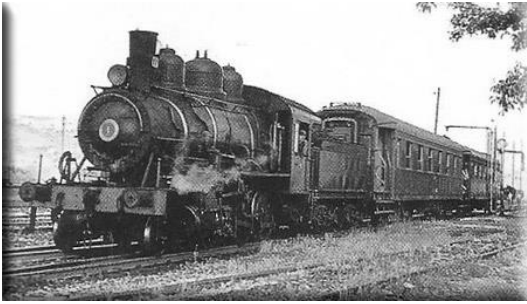
Tren que Transportaba tropas en 1924

LA COYUNTURA POLITICA “HONDURAS”. Para imponer sus designios en Honduras, el imperio aprovechó la coyuntura que representaba la ambición política de Tiburcio Carias Andino, pues los liberales, Dr. Policarpo Bonilla y Juan Ángel Arias, eran constitucionalistas y patriotas, por lo que la estrategia de las bananeras fue no dejarlos llegar al poder de la nación. En esta época el gobierno de los Estados Unidos intervenía encubiertamente en Guatemala y Costa Rica, y abiertamente en Nicaragua.