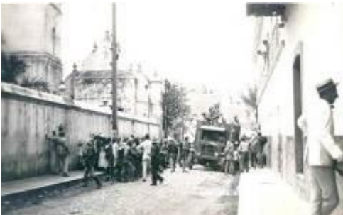
Tropas gringas en la Calle norte de la Catedral de Tegucigalpa (1924).

Los historiadores de la época narraron la participación de los diplomáticos extranjeros, de las compañías extranjeras, de los comerciantes extranjeros que vivían en Honduras, de los marines que para intimidar al gobierno legítimo desembarcaron en Honduras, de los pilotos estadounidenses que bombardearon Tegucigalpa, pero no descifraron la política intervencionista extranjera para ensanchar su comercio y controlar las rutas interoceánicas, pues eran dos guerras en una.