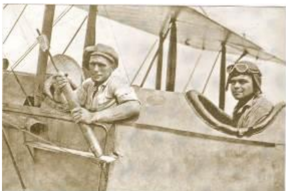
Pilotos estadounidenses en Avión Lincoln Estándar, bombardeando Tegucigalpa.

La ciudad de Tegucigalpa se convirtió en la primera capital de Latinoamérica en ser bombardeada, la supuesta “revolución contaba con un avión” aunque las bananeras eran dueñas de dos iguales, desde el cual los pilotos “mercenarios” arrojaban a mano las bombas. Las fuerzas gubernamentales contaban con el avión BRISTOL F-2B.