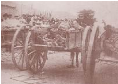
Carreton de cadaveres.

El 16 de abril llegaba a la capital hondureña el señor Summer Welles como representante personal del presidente de los Estados Unidos, Mr. Calvin Coolidge, para conferenciar con el gobierno de Honduras y con los alzados en armas a fin de convenir en las bases que discutidas, determinarían la paz de los hondureños.