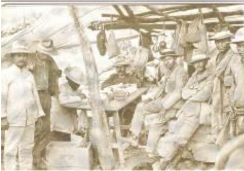
Cuartel “La Aserradera”, en Comayagüela en el sitio “Las Torres” de la Tropical Radio, para la comunicación Inalámbrica Honduras con Estados Unidos.