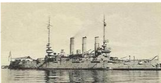
Cañonera Rochester, febrero de 1924.