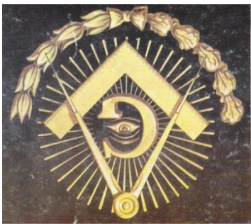
LOGO MAZONICO (El ojo, el compás y la escuadra)