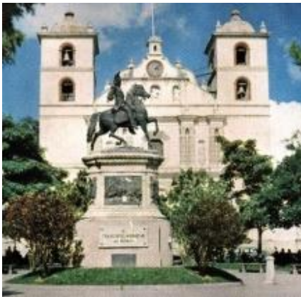
Estatua ecuestre del estadista Francisco Morazán, Federalista, paladín de la libertad de culto y de la educación popular, (1883) Tegucigalpa.

Las religiones, como las luciérnagas, necesitan de oscuridad para brillar. Arthur Schopenhauer (Filósofo)