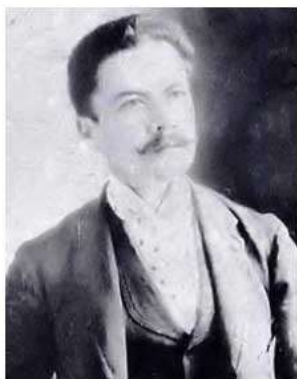
Rubén Darío en Chile a finales de 1888.