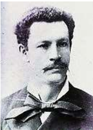
Juan Montalvo, ecuatoriano.