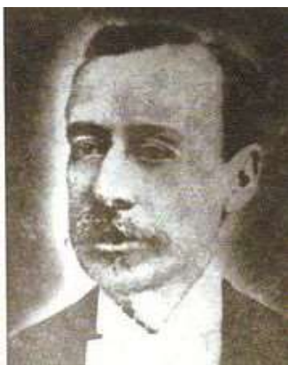
Rafael Zaldívar, presidente de El Salvador, médico, anticlerical, unionista, conservador Y benefactor de Darío.

Así se ligó en el oficio de periodista y consecuentemente se vio precisado a convivir en un mundo de imprentas, litografías, fotógrafos y editores, donde bregaban músicos, pintores, poetas y algunos artistas “semi-locos”. En 1883, se embarcó para El Salvador, llevaba la corresponsalía de periódicos de Nicaragua , su labor era recolectar, resumir, ponderar y publicar información relativa a los sucesos de su tiempo.