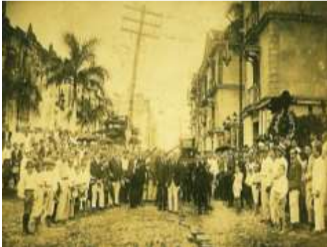
Entierro de Rubén Darío

CAVILACIONES SOBRE EL CAMINO ANDADO, las imitaciones de su arpa , la esencia de las flores de todos los jardines, periodismo como oficio y poesía como arte : “La carencia de una fortuna básica me obligó trabajar periodísticamente” pero dedique el resto de mis vagares al ejercicio puro del arte y de la creación mental”. “ No solo de las rosas de Paris extraje esencias sino de todos los jardines del mundo ”. “Amor bajo todos los soles, pasión de todos los colores y todos los tiempos” “ no he encontrado suficientemente maciza y fundamentada mi fe ”.