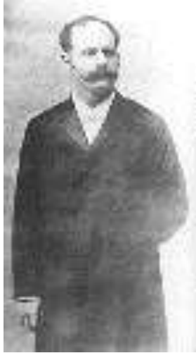
General José Santos Zelaya

El presidente Zelaya lo nombró representante diplomático de Nicaragua en Madrid , su misión representar los intereses de su país en el reino de España. En 1908 presenta credenciales ante el Rey Alfonso XIII. También fue nombrado embajador en París, Francia para manejar negociaciones con la Compañía del Canal (interoceánico) de Fernando Lesseps, este fue el constructor del Canal de Suez.