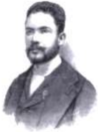
Rubén Darío en 1892.