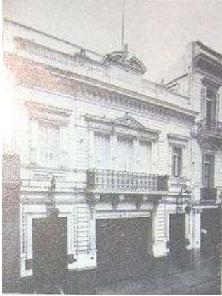
Edificio del Periódico La Nación” Buenos Aires, Argentina, época Dariana.

Cónsul y periodista en Argentina. 1893 -. De regreso de España a Nicaragua estando en Panamá recibió la noticia de que el presidente de Colombia Miguel Antonio Caro lo había nombrado cónsul honorario en Buenos Aires, entonces viajó a Panamá y luego a Buenos Aires en su condición de Cónsul de Colombia. Realizó escalas en Nueva York, donde conoció al literato y patriota cubano José Martí; y pasó por París donde se encontró con otro de sus émulos el poeta Paul Verlaine.