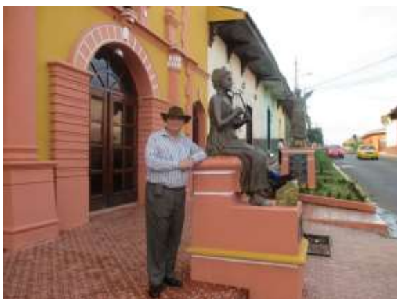
Teatro Municipal, José de la Cruz Mena, León, Nicaragua.

Rubén Darío, nació en Metapa un 18 de enero de 1867; fue leones de León, Nicaragua; poeta, periodista, diplomático y un cosmopolita que vivió en Centroamérica y en las cosmopolitas ciudades de: Buenos Aires, Argentina; Madrid, España; París, Francia, y pernoctó en la ciudad más internacional del mundo, New York, EE.UU; habló en francés y según el mismo nos refiere logró conocimientos del inglés, italiano y latín.