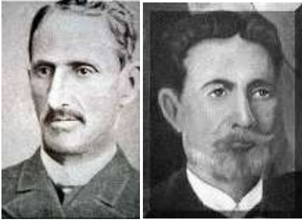
Francisco Menéndez y Carlos Ezeta.