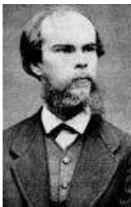
Paul Verlaine, el simbolista.