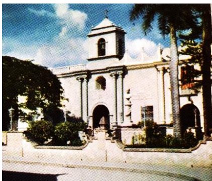
Plazoleta La Merced (1965)

1.- La plazoleta; 2.- El edificio de la facultad; 3.- La rectoría; 4.- Las notables; 5.- Otras facultades