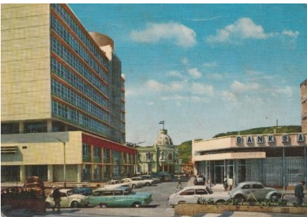
Bank of América, Banco Central, Casa presidencial, entorno de la Facultad de Derecho (1968).

En la boleta en letra roja escribían los APLAZADO de 31 a 54 e INSUFICIENTE de 0 a 30. En su caso, se aplicaba la regla del 8, pues 3 por 3, igual nueve, pero se pasaba con ocho.