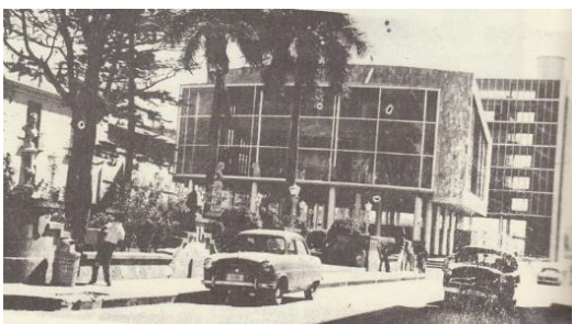
Palacio Legislativo con vidriera, contiguo a la plazoleta La Merced (1965)

La tradición exigía a los alumnos de cursos superiores perseguir a los alumnos de primer ingreso y pelonearlos para que el pueblo supiera que eran nuevos estudiantes de derecho y los distinguiera como tal, solo se escapaban de esta singular distinción las mujeres.