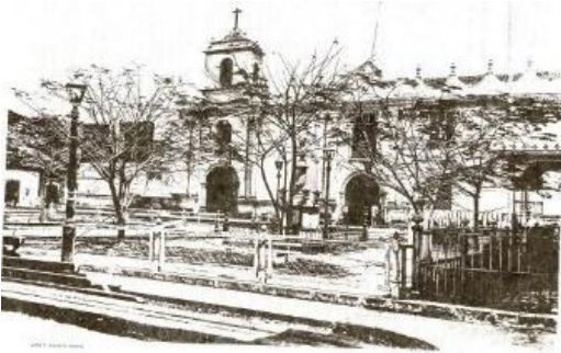
Universidad Central (1882) Ilustración aparecida en Primer Anuario Estadístico de 1889.