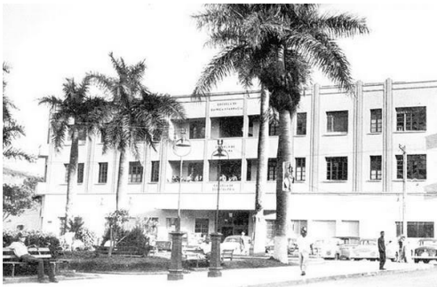
Edificio de las facultades de Medicina, Química y Farmacia y Odontología frente al Parque "La Libertad", Comayagüela, (1965).

surgieron oradores y panfletistas; algunos cultivaban el buen hablar y vestir, otros grandilocuentes, otros simulaban humildad comparando sus aldea o poblado de una sola calle con la capital, vinieron deportistas, filósofos y hasta narcisistas que portaban un espejito en su bolsa en el cual se miraban constantemente e incluso conversaban consigo mismo.