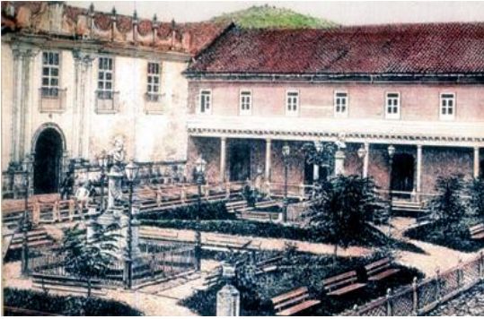
Parque Soto, el Paraninfo universitario y la primera casa presidencial en Tegucigalpa a fines del siglo XIX.

A partir de 1882, la facultad se trasladó contiguo al Convento la Merced y a pocos pasos del Poder Legislativo y de la vieja casa presidencial. Esta reforma abandonó la escuela escolástica y la substituyó por el laicismo y positivismo en el proceso enseñanza aprendizaje.