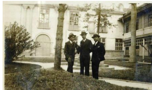
Entrada a la Facultad de Derecho y al Paraninfo 1922, a la derecha el palacio viejo.

En sus albores cuando se enseñaba derecho civil y penal el método de estudio consistía en concordar los códigos de Honduras con los códigos disponibles de España, México y sur América.