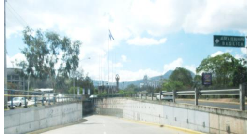
A la izquierda el camino a la luz de la universidad y a la derecha al Santuario de Suyapa.

Muchos alumnos venían mal preparados de Colegios privados nocturnos pero terminaron graduándose de Licenciados en Derecho, asimismo facilitaron la licenciatura a militares y agentes de los cuerpos de investigación.