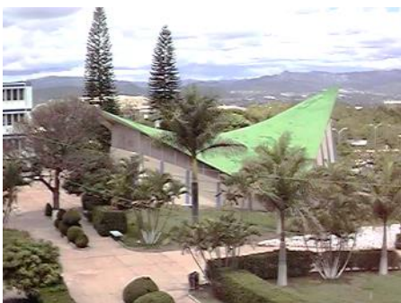
Auditórium en la ciudad universitaria con forma de Cofia (1969)

En 1968, se modifica el reglamento del Consultorio Jurídico Gratuito para práctica forense el cual había sido aprobado en 1960.