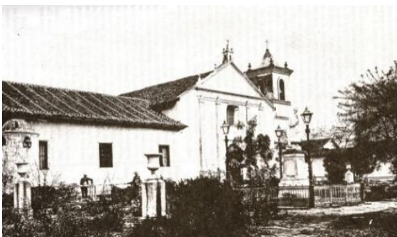
Convento San Francisco, Edificio público convertido en sede de la primer Universidad en 1847.

1.- PRIMERA 1847; 2.- SEGUNDA 1882; 3.- TERCER 1957; 4.- CUARTA 1982.