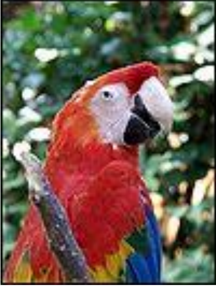
(La Guacamaya) Ara macao.