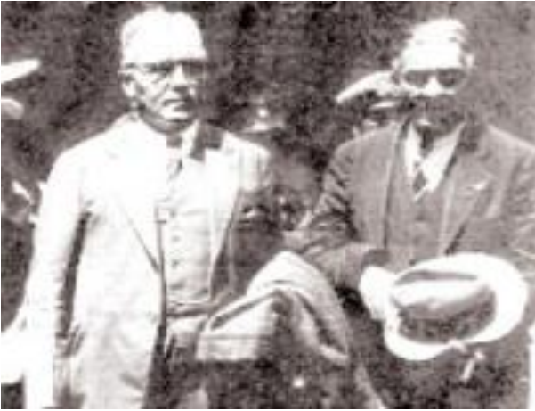
Fotografía de Coello y Hartling 1919.

El himno está compuesto de un coro y siete estrofas, las cuales relatan eventos históricos por los cuales atravesó Honduras, fue cantado por primera vez el 15 de septiembre de 1904 por las alumnas de la Escuela Normal de Señoritas, pero fue estrenado meses antes en la Escuela Guadalupe Reyes de Tegucigalpa y dirigido por Carlos Hartling.