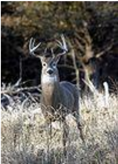
Venado Cola Blanca.

Como una medida para preservar la fauna Nacional y sobre todo el medio ambiente de la depredación desmedida, el Congreso Nacional de la República emitió el decreto ejecutivo N° 36-93 con fecha 28 de junio de 1993, el cual instituye como símbolo de la Fauna Nacional el “Venado Cola Blanca” ( Odocoileus virginianus ).