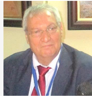
Por: León Rojas Caron.

Los símbolos son alegorías o ayudas visuales para que cada quien se identifique con su patria, para que según su bagaje cultural se forme su propia idea de los valores culturales.